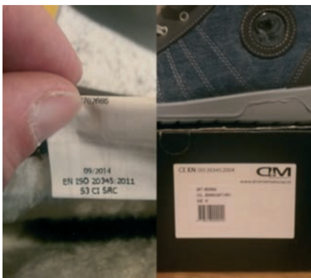
Correcte normering in de schoen komt niet overeen met de verlopen normering op de schoendoos

In één geval is een brief verstuurd naar de Engelse fabrikant. De Engelse fabrikant verleende medewerking en heeft direct maatregelen getroffen.